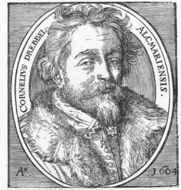
CORNELIS DREBBEL, (1572 – 1633.)

"Ik zie de schavotten buiten en ik hoor over de executies, die je laat uitvoeren; ik smeeke je, breng niet een van s'werelds wijste mensen om: Cornelis Drebbel".