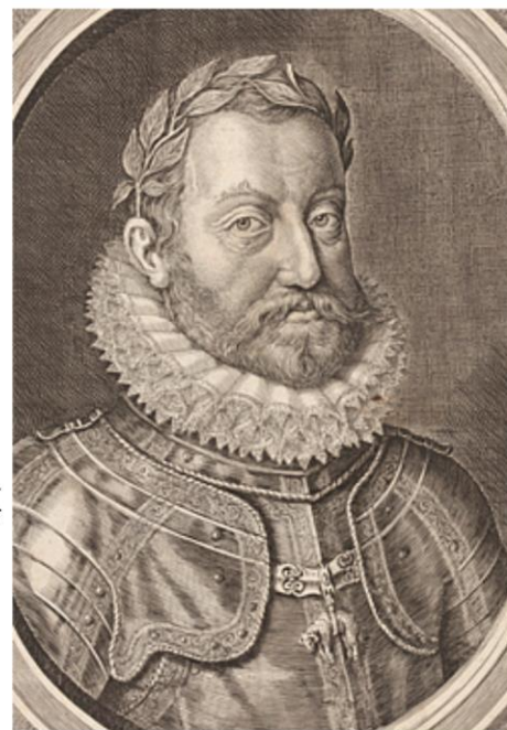
RUDOLF II, (1552 – 1612.)

Tijdens Rudolfs regering kwam de kunstvorm, het maniërisme (Italiaans: maniera=stijl; stroming tijdens laat-Renaissance en aankomende Barok) tot grote bloei. Waarschijnlijk kent u de portretten van Rudolf van de hand van Guiseppe Arcimboldo; het gezicht van Rudolf wordt opgebouwd uit fruit en groenten.